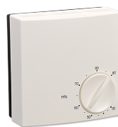
LTM TL HUMIDITY