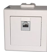
LTM dezent APD BT