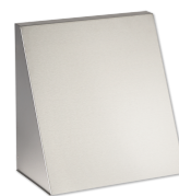
LTM dezent BA VA 410 B